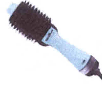
Escova Secadora Britânia Soft BEC05T 3 em 1...