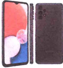
Smartphone Samsung Galaxy A13 Preto, 128G...