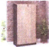
Armário Alto para Escritório 2 Portas Espresso Móveis Calvi/Preto